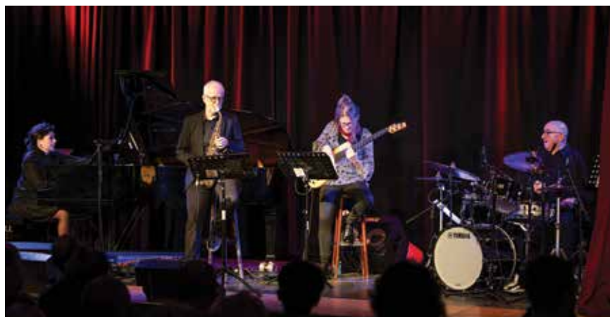
Profesjoniści w akcji