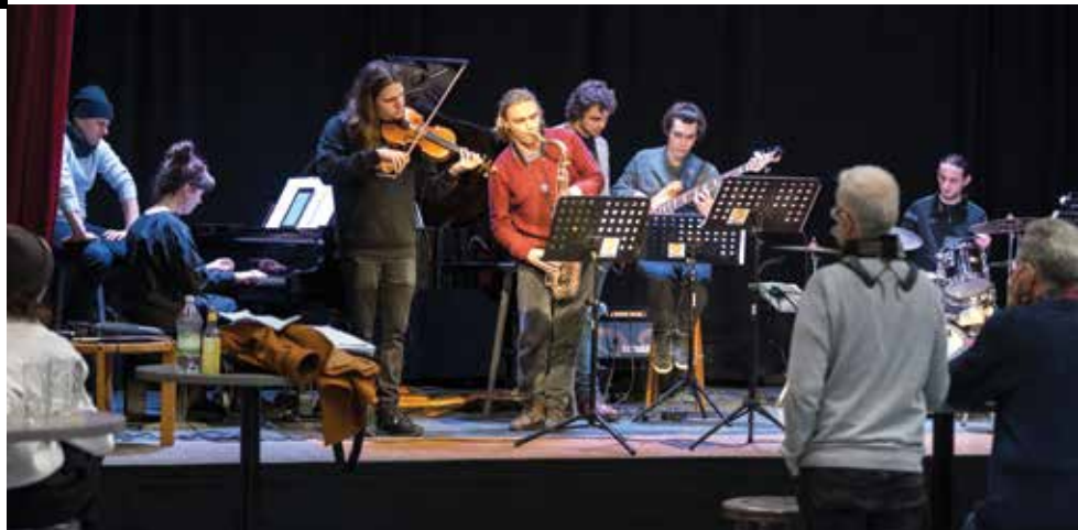
Uczestnicy warsztatów przygotowują repertuar na koncert pod okiem doświadczonych muzyków