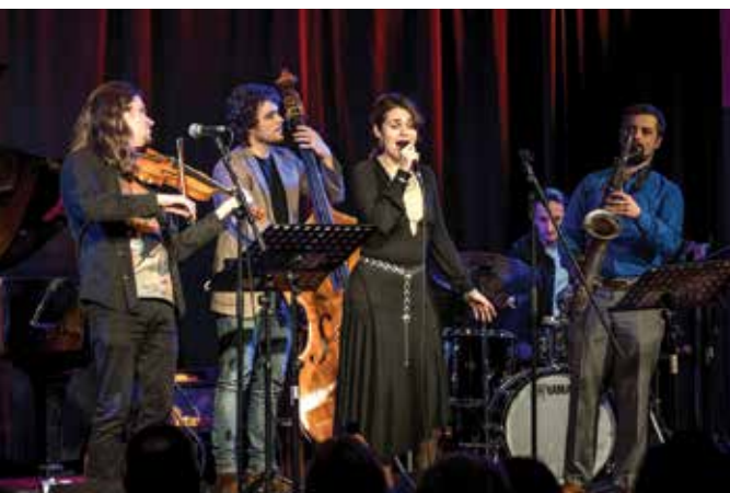
Młode talenty na scenie

Koncert można śmiało określić sensacją. Pomimo konkurencji innych festiwalowych wydarzeń sala pękała w szwach, a 160 widzów było świadkami wspaniałego występu. Jednak muzyczna strona to tylko jeden wymiar tego projektu. Równie istot-